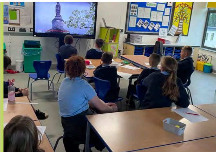
Gwrando ar glip fideo y BBC – dymchwel cerflun Colston yn 2020

I gychwyn ein gwaith ar hiliaeth, trafodwyd y term 'hiliaeth' a 'gwrth-hiliaeth'. Gwrandawodd y plant ar wahanol achosion o hiliaeth. Roedd hyn yn cynnwys rhai achosion ffuglenol gall ddigwydd ym mywyd bob dydd, a rhai achosion go iawn fel hanes George Floyd, Rosa Parks ac Edward Colston y caethfasnachwr o Fryste. Roedd y gweithgaredd yma wedi annog llawer o drafod, yn enwedig wrth geisio trefnu'r esiamplau yn ôl beth oedd y plant yn meddwl oedd yr achosion mwyaf i leiaf difrifol. Cafodd y plant gyfle i rannu a thrafod eu barn a defnyddio empathi wrth drafod yr achosion ac ystyried teimladau'r dioddefwyr. Erbyn diwedd y wers, dengys y plant ddealltwriaeth glir o ystyr y term 'hiliaeth' a 'gwrth-hiliaeth', gyda nifer wedi syfrdanu ar hyn a glywyd.